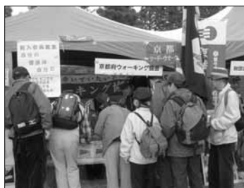
KWAの展示テント(植物園にて)

「明日の京都づくり府民会議」主催のウォーキングはKWAほか4団体が参加しました。ゴールの植物園では、京都府のゆるキャラが勢ぞろいし、木工教室、手作り甲冑隊の体験、警察音楽隊などイベントたっぷり、6000人の参加者も大いに満足でした。