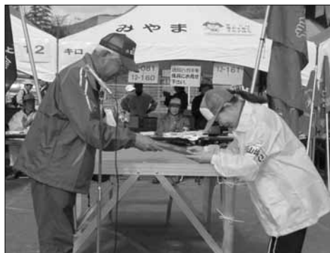
美山ワンデーマーチにて