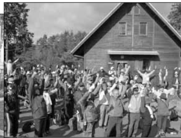
大正池グリーンパークにて