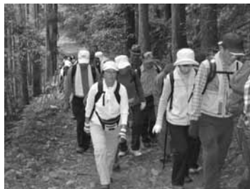
清滝川沿いの山道

晩秋の好天に恵まれ173人も初参加者が有りました。広沢池から京見峠へ急坂を越え、高雄から清滝にかけて赤や黄色に見事に色づいた山を楽しみ、ゴールの保津峡駅まで歩きました。