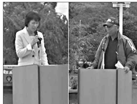
1800W 木津川市大会にて