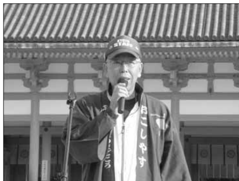
京都ツデーウォークにて

2年後には協会発足25周年を迎えますので、発足記念実行委員会を立ち上げました。毎月実施の例会、平日、基地及び歩育ウォーク等も、是非ご期待下さい。本年も会員の皆様にウォークを楽しんでいただけるように努力してまいりますので、ご参加をスタッフ一同お待ちしております。