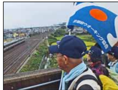
大山崎跨線橋にて

道すがらコース地図に記載の列車を確認しながらの鉄道ウォークで、すべての車両を確認されたマニアが大勢おられ、皆楽しそうでした。