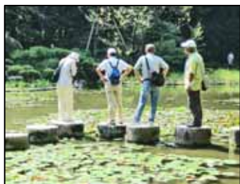
睡蓮が満開(蒼龍池)

心配していた朝の雨雲は消え、暑い日差しの中のスタートでした。心地よい風もありましたが日差しは強く、参加者には水分補給を促しつつ、高台寺公園で休憩の後に岡崎公園に到着。昼食後は平安神宮神苑を拝観、萩の花や栖鳳池に浮かぶ泰平閣などを見ながらゆっくりと散策しました。その後鴨川河川敷から五条公園を経てKWA事務所にゴールしました。多くのご参加ありがとうございました。