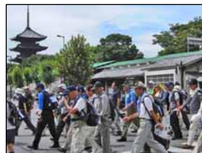
東寺の塔を見ながら

協賛頂いた(株)京都タワー様から様々な景品が提供され、お楽しみ抽選会は、おおいに盛り上がっていました。