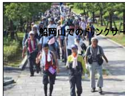
宝ヶ池公園をスタート

上賀茂神社からは11 キロ 、18 キロ コースと合流し、落ち着いた社家が並ぶ川沿いの道では、写真を撮る人も見られました。大田神社から深泥池児童公園を巡り、ボートが浮かび、国際会議場を望む宝ヶ池畔でしばし休憩して、木陰が多い池の畔の小道を抜け、宝ヶ池公園北園にゴールしました。ウォーキングシューズをはじめ、景品満載の抽選に皆歓声を上げていました。