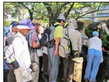
不二の水(藤森神社)

この日は日差しも強く暑かったのですが、多くのご参加を頂き、伏見の名水を試飲したり、酒造元で買い物を楽しんだりされる姿も見られました。