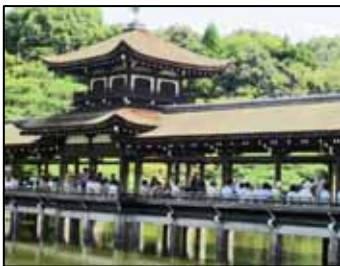
栖鳳池に浮かぶ泰平閣