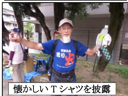
懐かしいTシャツを披露