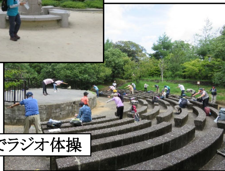
船岡山公園でラジオ体操