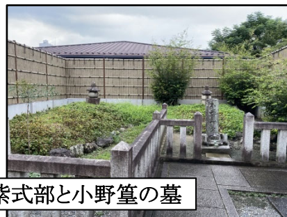
紫式部と小野篁の墓