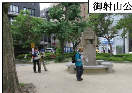
御射山公園のラジオ塔

夏の終り、少し涼しくなり、風もあって、歩きやすくなった気候のもと、約100年前の遺跡を残す京の街を楽しく歩くことが出来ました。