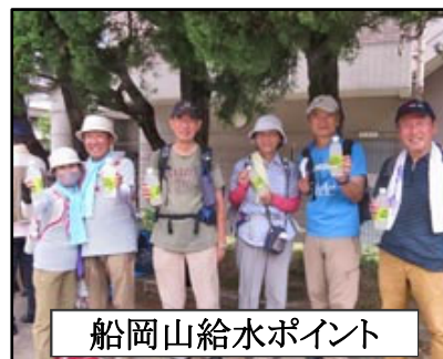
船岡山給水ポイント