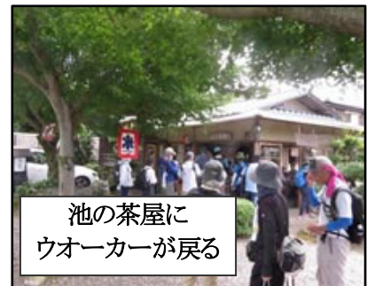
池の茶屋に ウォーカーが戻る