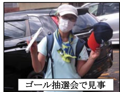
ゴール抽選会で見事