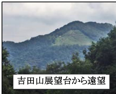
吉田山展望台から遠望