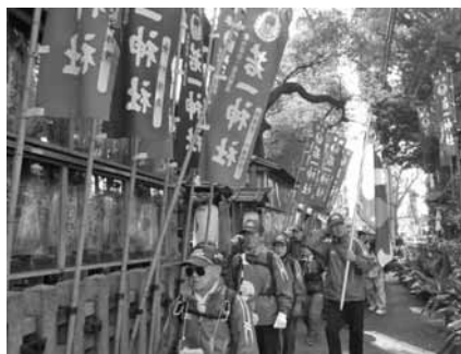
若一神社前に行く

午後からは建築方除の大將軍八神社、開運の平野神社、安産のわら天神、延命長寿の熊野神社衣笠分社を参拝し、御利益を頂きながら、晴々とした表情で、円町駅にゴールしました。