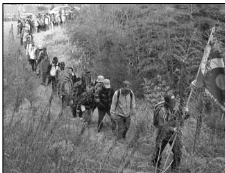
友愛の丘に向かう

午後からは2コースに分かれ13 ヶ 口コースは、30分ほどで無事玉水駅にゴールしました。23 ヶ 口コースは、山背古道一番のビューポイントと泉橋寺の大きな地蔵仏などを堪能して無事、JR木津駅に到着しました。