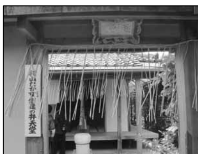
たか女創建の弁天堂