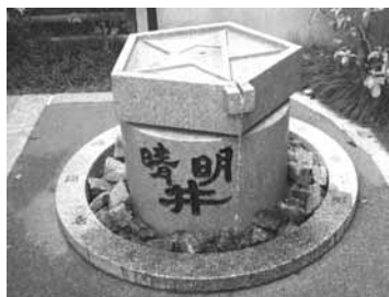
晴明井戸(晴明神社)