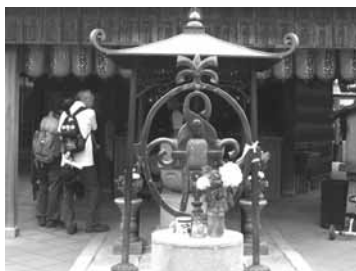
巨大な釘抜(釘抜き地蔵)