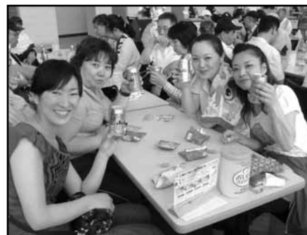
華やかな試飲会場

お待ちかねのビール試飲会場では、ギャル達が美味しそうにビールを飲み干す姿が、まぶしく感じられました。