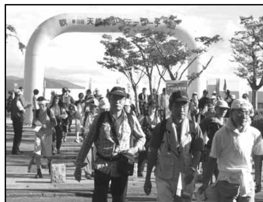
ゲートをくぐりスタート