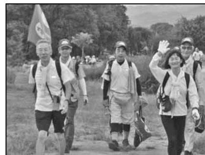
完歩に喜ぶ ウォーカー(16日)