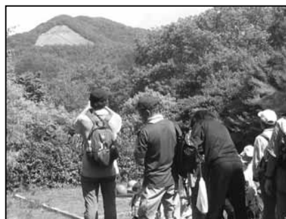
吉田山から大文字火床を観望(15日)