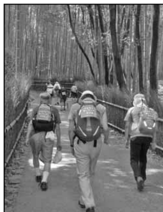
嵐山の竹林を行く(16日)