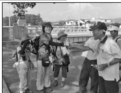
北大路橋の 給水所(16日)