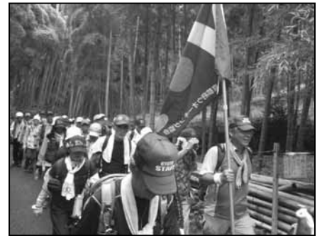
竹の下みちを行く

昼食後は、歩きやすく整備された竹の下みちから朱色の千本鳥居をくぐり、1300年祭に向けての工事が急ピッチで進められている伏見稻荷大社にゴールしました。