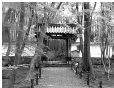
地蔵院(竹の寺)にて