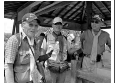
船岡山上でうれしい給水