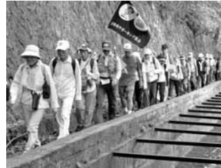
緑陰あふれる水路閣

翌16日、嵐山中ノ島公園を出発、鳥居、左大文字の火床を観望し、船岡山に到着。山上のドリンクサービスで一息つき、後半の火床観望コースを巡り、出町柳のゴールに無事到着しました。夜8時には、夜空を焦がす大文字の火に行く夏を惜しみました。