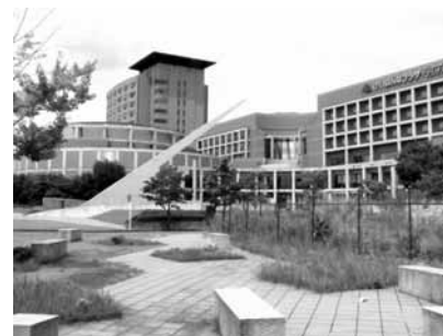
けいはんなプラザ中央