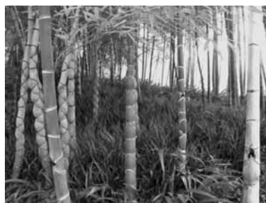
洛西竹林公園で珍しい竹を見る