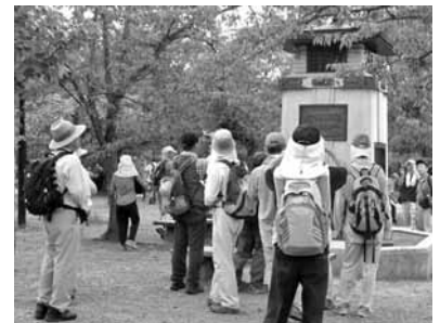
円山公園ラジオ塔に集う

猛暑の続く中、新聞やテレビでも取り上げられたラジオ塔遺構を巡るウォークに参加いただき、橋兒童公園、小松原公園のラジオ塔を訪ね、船岡山公園に至りました。毎朝、船岡山公園でラジオ体操を続けておられる地元の人達と一緒に、盛大にラジオ体操をしました。後半の紫野柳公園、萩公園のラジオ塔を巡り、休憩時のカチワリ氷で一時的涼を得、よく知られている円山公園ラジオ塔前に無事ゴールしました。