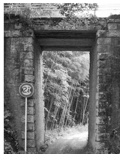
現在も活躍中の赤橋