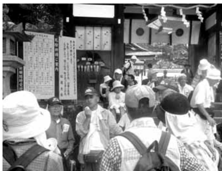
松尾大社で語部が歴史を説く

午後には、さんさんと陽が注ぐ桂川沿いの河川敷を、涼を求め北へと歩を進めました。路上温度計37の表示に驚きながら、月読神社や松尾大社に到着すると、嵐山の緑陰が優しく迎えてくれ、阪急・嵐山駅に無事ゴールしました。