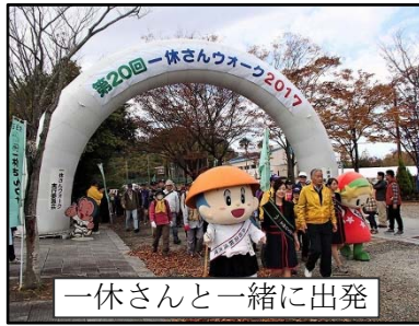
一休さんと一緒に出発