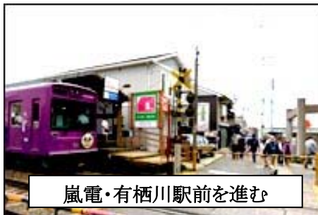
嵐電・有栖川駅前を進む

午後には車折神社駅、有栖川駅、帷子ノ辻駅、蚕の社駅を巡り、四条大宮駅に無事ゴールしました。