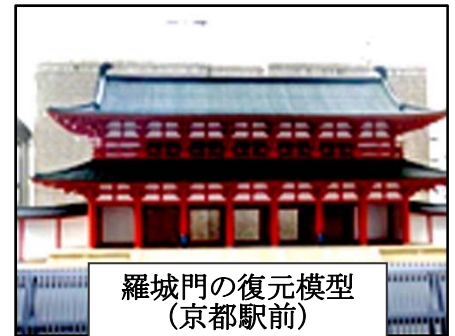
羅城門の復元模型 (京都駅前)