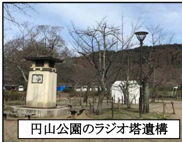
円山公園のラジオ塔遺構