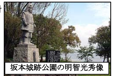
坂本城跡公園の明智光秀像