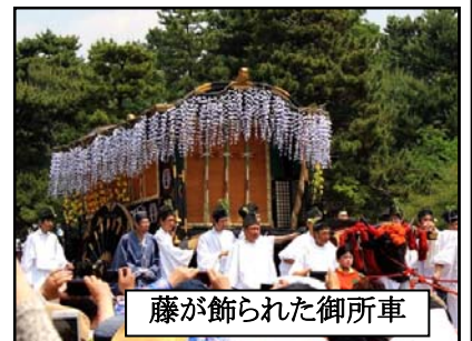
藤が飾られた御所車