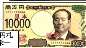
新1万円札 渋沢栄一